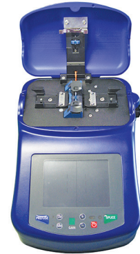
ZEUS D50 Fusion Spleißgerät