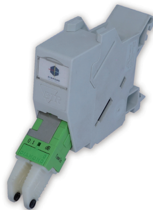
E-2000® Hutschienenmodul IP65-Version